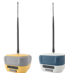
HiPer XR GRX5