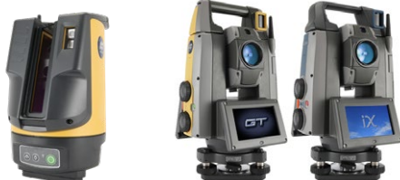
LN-1000i/LN-160 GT-1500/700シリーズ iX-1500/700シリーズ