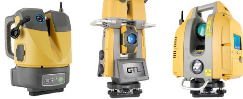
ESN-100 GTL-1200 GLS-2200