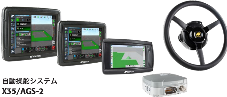
自動操舵システム X35/AGS-2 X25/AGS-2 XD/AGS-2

※ USB Wi-Fi アダプタが必須となります。 ※お客様ご自身の Wi-Fi ルータ、もしくはスマートフォンのデザリング機能によるインターネット通信が必須となります。