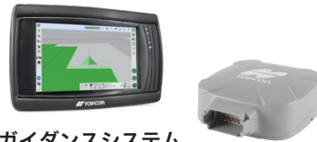
ガイダンスシステム XD/AGM-1

※ USB Wi-Fi アダプタが必須となります。 ※お客様ご自身の Wi-Fi ルータ、もしくはスマートフォンのデザリング機能によるインターネット通信が必須となります。