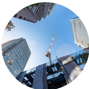
上空視界の狭い 都市部工事