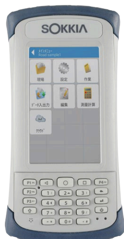
データコレクター SHC600