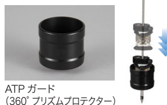
ATP ガード (360° プリズムプロテクター)