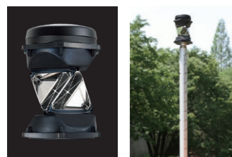
360° プリズム ATP2