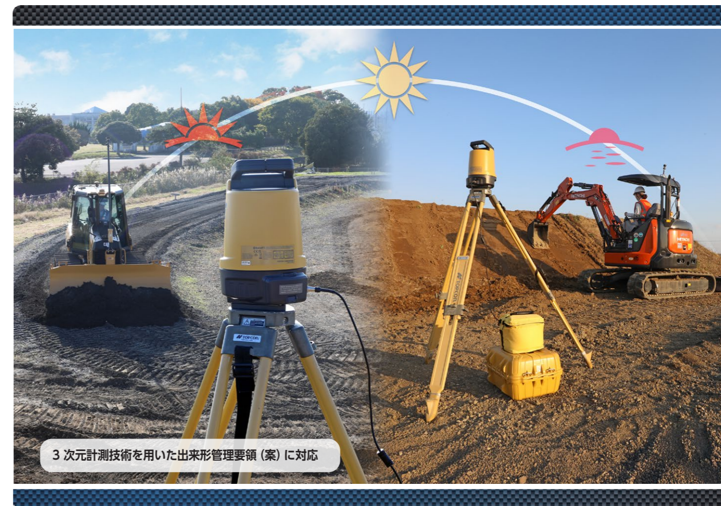
3次元計測技術を用いた出来形管理要領(案)に対応