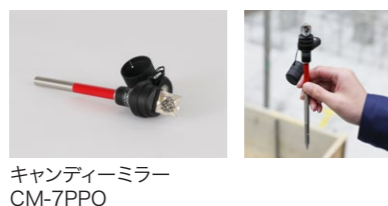
キャンディーミラー CM-7PPO