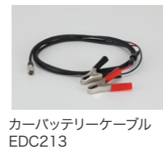
カーバッテリーケーブル EDC213