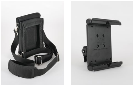
・ソフトケース ・ RTK ポール用クレードル