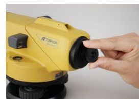
40x 接眼レンズ EL5 (AT-B2)

また、光学マイクロメーターと合わせて機器検定を受けることで、公共測量の2級水準測量を行うことができます。