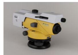
光学マイクロメーター OM5 (AT-B2)

望遠鏡に光学マイクロメーターを取り付けることにより 0.1mm まで高さを読取ることが可能となります。精密な水準測量として、工作機械の据付等、高精度が要求される作業に活用いただけます。